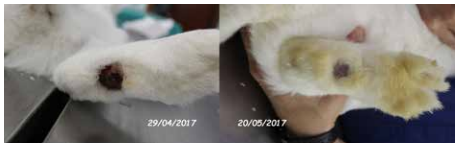
Foto 9 piede sinistro prima e dopo il trattamento (la differente colorazione del pelo dipende dal cambiamento del substrato)

in gruppo all'interno di un ampio ricovero dedicato, il cui fondo è stato cosparso di fieno e truciolo di legno, per uno spessore di 2 cm circa. Al giorno 0, momento dell'arrivo e del ricovero all'interno della struttura sanitaria, le lesioni sono state fotografate e ripulite mediante scrub energico della zona lesa per asportare il materiale necrotico, utilizzando garze imbevute di una soluzione di clorexidina allo 0,5%. Dopo l'asciugatura le lesioni sono state trattate con un prodotto formulato in lozione spray a base di Morinda citrifolia, Calendula officinalis, Hammamelis virginiana e colostro bovino, un presidio registrato per cani e gatti e largamente utilizzato in queste specie, dalle proprietà ripitelizzante, cicatrizzante,