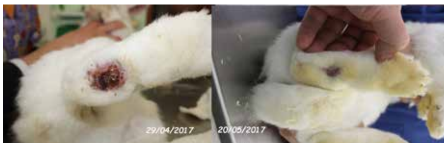
Foto 8 piede destro prima e dopo il trattamento (la differente colorazione del pelo dipende dal cambiamento del substrato)