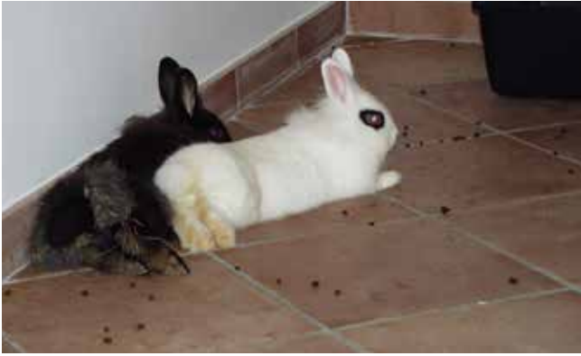
Foto 5 fondo inadeguato e condizioni igieniche scadenti sono fattori predisponenti

soggetti destinati alla macellazione, favorite inoltre da scarse condizioni igieniche e da una carica microbica ambientale piuttosto elevata. Anche nel coniglio da compagnia l'igiene gioca un ruolo fondamentale in quanto la permanenza su una lettiera sporca ed umida favorisce la macerazione del pelo e della cute e predispone all'insorgenza di infezioni batteriche secondarie. Tra le altre cause predisponenti la comparsa delle lesioni tipiche della pododermatite ulcerativa vengono indicate l'obesità, che aumenta i fenomeni compressivi locali, e la scarsità di movimento, dovuta alla carenza di stimoli, al confinamento in ambienti ristretti, al sovrappeso o a stati di sofferenza cronica (ad es. spondilosi ed osteoartrite), che concorrono a ridurre l'efficacia del microcircolo locale e favoriscono l'ischemia della regione con successiva necrosi tissutale. Anche patologie urinarie, in grado di provocare incontinenza, e gastroenteriche, che determinano la produzione di feci diarroiche, possono causare imbrattamento della parte e, aumentando l'umidità e la contaminazione batterica del substrato, favorire la comparsa delle lesioni. Anche la presenza concomitante di malattie parassitarie che possono determinare la comparsa di lesioni cutanee o alopecia localizzata alla superficie plantare degli arti o alla regione periungueale (ad es. rogna sarcoptica o dermatofitosi) possono fungere a loro volta da fattore predisponente.